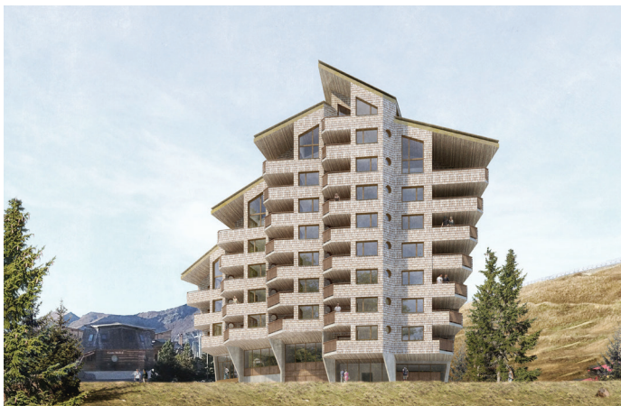
022 FESTIVAL Construction Hôtel à Avoriaz 2 100 m 2 | 5 200 k€ | privé Concours TEMPLE