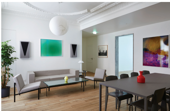
064 HANABI Restructuration complète Bureaux a Paris 160 m 2 | 230 K€ | privé Livré en 2023