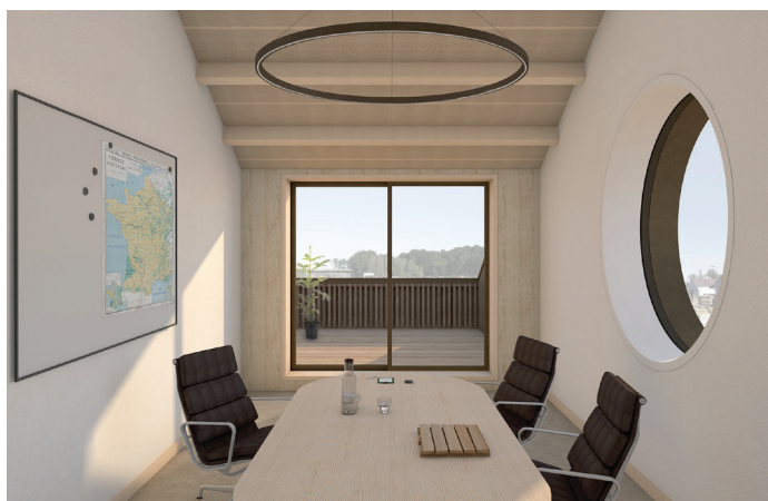
027 LA MACHINE Construction Bureau à La Machine 88 m 2 | NC | BBF scierie Livraison en 2022