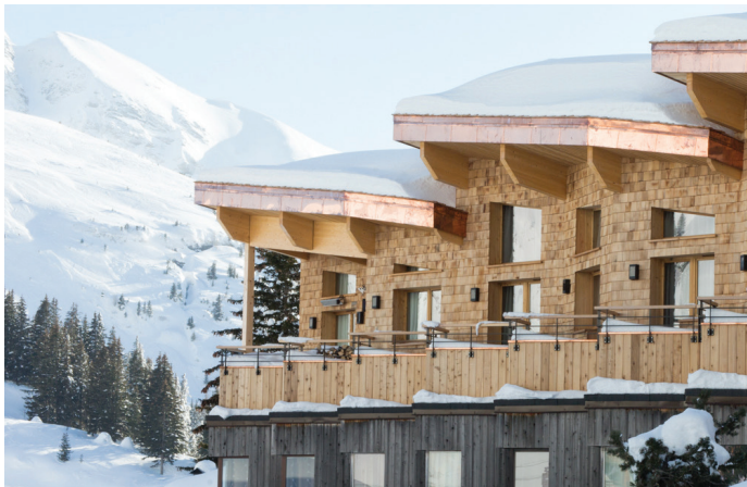
016 CHALETS Construction en surélévation 2 Résidences de vacances 415 m 2 | 2 000 K€ | privé Livré en 2021