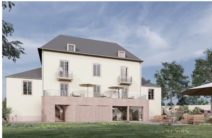
081 VAL D'ARON Réhabilitation lourde et extension Hôtel-restaurant 430 m 2 | 1 317 K€ | Nièvre Aménagement Etude en cours