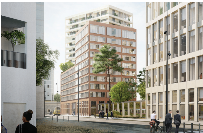
013 GRAND PARC Construction Hotel | Villejuif NC | NC | Linkcity Concours