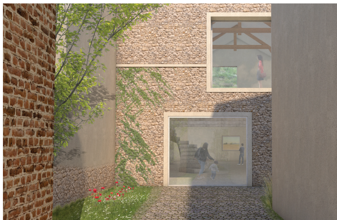
048 GRANGE AUX FRAISES Construction en extension et réhabilitation Halle d'exposition polyvalente NC | NC | commune de Bièvres Concours